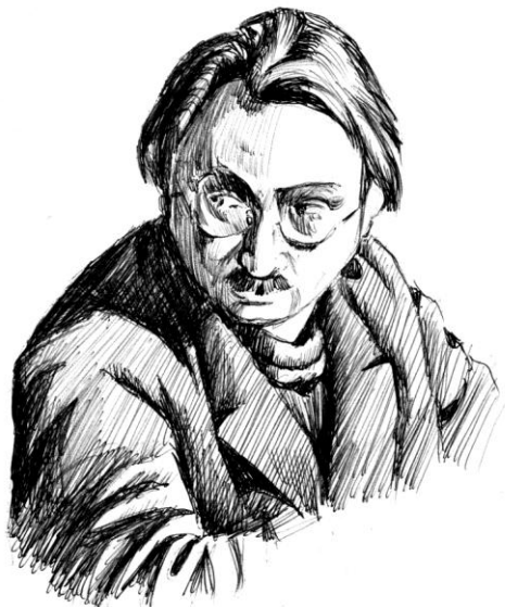
Рисунок Владислава Цана

1 февраля исполнилось 140 лет со дня рождения еврейского политического деятеля и публициста Абрама Наумовича Мережина.